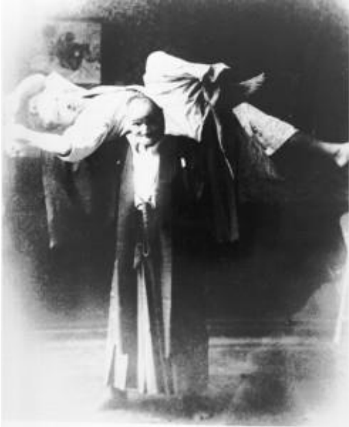
Resim 1 Takeda Sokaku bir gazete için poz verirken

Morihei Ueshiba'nın hocası Takeda Sokaku, ailesinin bağlı olduğu Aizu klanının, Meiji döneminden yüzyıllar öncesine dayanan savaş sanatları geleneğini, 19.yüzyılın sonlarına doğru Japonya'ya yaymaya başlamıştır. Jujutsu öğretilerinden oluşan ve ismine Daito-ryu Jujutsu (sonradan Daito-ryu Aikijujutsu) dediği sanatı Japonya'yı gezerek verdiği sayısız seminerlerde askerlere, polisler ve birçok savaş sanatı meraklılarına öğretmiştir. Daito-ryu kaynaklarına göre, Morihei Ueshiba'nın Takeda'yla ilk tanışması 1915 yılında gerçekleşmiştir. O zamanlar 32 yaşında olan Ueshiba, Takeda'nın Hokkaido'da verdiği seminerlere katılmış, sonradan da evine davet ederek orada özel Daito-ryu dersleri almıştır. Ne yazık ki, bu özel eğitimin ne kadar sürdüğü ve ne yoğunlukta olduğu bilinmemektedir [1].