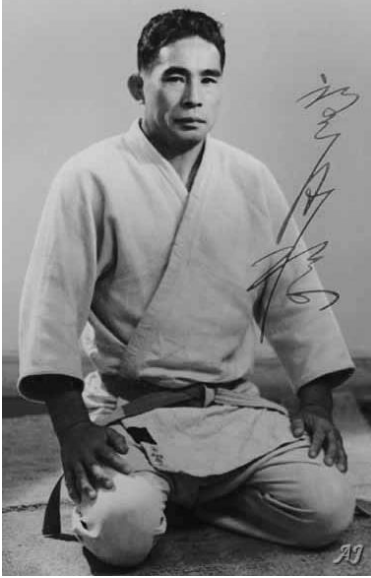
Resim 2 Minoru Mochizuki (1907 – 2003)

Minoru Mochizuki Sensei'nin kurduğu Yoseikan Budo savaş sanatları okulunda gösterilen Aikido stildir. Mochizuki Sensei, 5 yaşında Kendo yaparak savaş sanatlarıyla tanışmıştır. Sonradan Judo'nun kurucusu Jigoro Kano'nun, Aikido'nun kurucusu Morihei Ueshiba'nın ve Shotokan Karate'nin kurucusu Gichin Funakoshi'nin doğrudan öğrencisi olmuş ve birçok savaş sanatını öğrenmiştir.