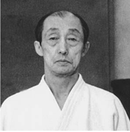
Resim 4 Kenji Tomiki (1900 – 1979)

eğitimlerine başlamış ve 28 yaşına geldiğinde Kano'nun okulundaki en yüksek seviye olan 5.dan seviyesine yükselmiştir. Jigoro Kano'nun Morihei Ueshiba'yla tanışıp sanatından ve disiplininden etkilenmesi ve kendi öğrencisi Tomiki'ye ders vermesini teklif etmesi üzerine Tomiki, Ueshiba'nın ilk öğrencilerinden biri olmuştur. 13 senelik sıkı bir çalışma sonrasında Kenji Tomiki, Aikido'da 8.dan seviyesine hak kazanan ilk öğrenci olmuştur [5].